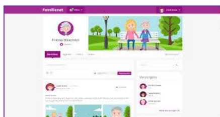
Familienet verbindt familie met zorg

Naast de vaste groep vrijwilligers bieden we ook een groep mensen uit Oekraïne, na hun vlucht, weer een plek om naar toe te gaan en helpen we hen in de maatschappij te komen. Een aantal weken worden we in de zorg o.a. vergezeld door 2 dames die in Oekraïne als arts werkten. Het was mooi om ervaringen uit te wisselen, hen de "Nederlandse Zorg" te kunnen laten zien inclusief al haar luxe. De passieve lift was een heel bijzonder object voor hen, waar ze echt verwonderd over waren. Enkele anderen werkten mee als gastvrouw in de huiskamer of in de huishouding. Later vonden zij elders woon en werk gelegenheid. Het was fijn om hen deze opstart te kunnen bieden.